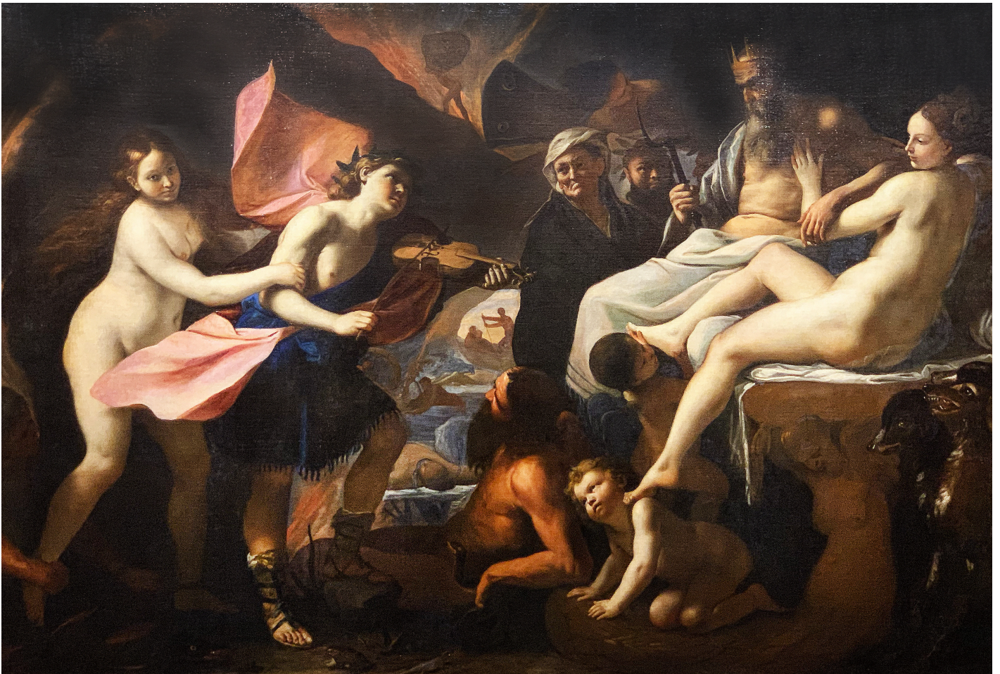
Mattia Preti (1613-1699). Orfeo nell'ade, 1635-40. Links der Sänger Orpheus mit seiner geliebten Eurydike.

https://www.artfritz.ch/webfotos/PDF/orpheus_eurydike.pdf