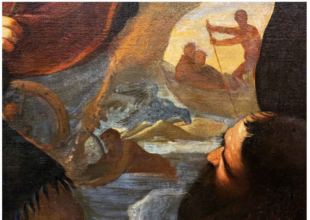
Links oben Sisiphus. Rechts in der Barke sitzend Dante und Virgil. Der Fährmann Charon rudert die Toten für einen Obolus über den Totenfluss. Darunter Prometheus, der vom Adler zerfressen wird. Links das Rad des Ixion, daneben der dürstende Tantalos bei seinen «Tantalosqualen».