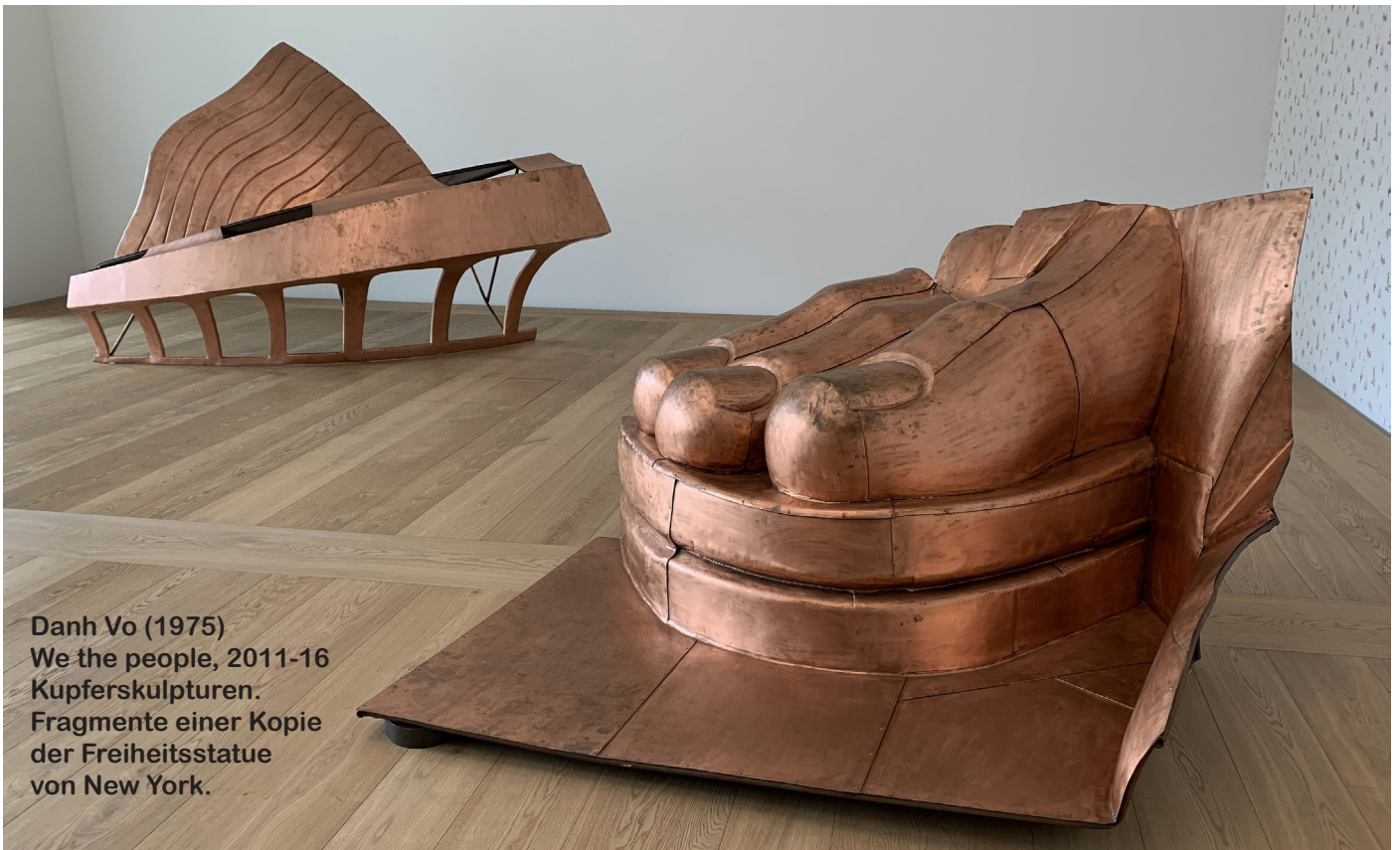
Danh Vo (1975) We the people, 2011-16 Kupferskulpturen. Fragmente einer Kopie der Freiheitsstatue von New York.