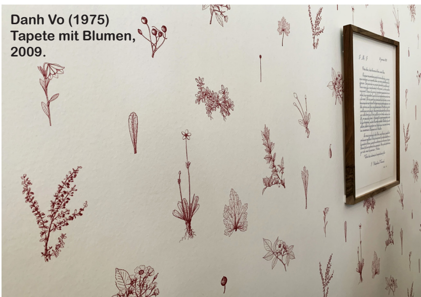
Danh Vo (1975) Tapete mit Blumen, 2009.