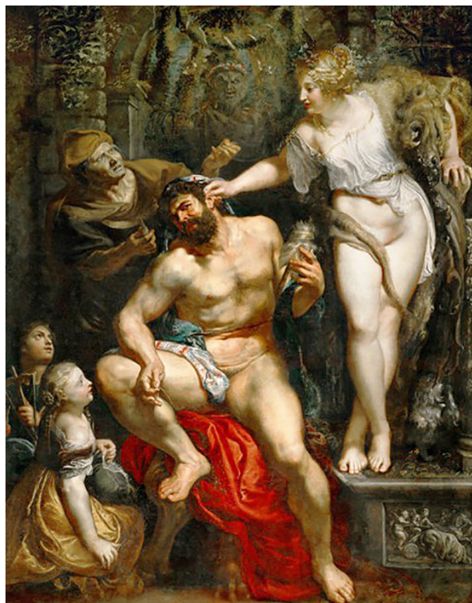
Peter Paul Rubens (1577-1640). Hercules und Omphale, 1602-05. Musée du Louvre Paris.

folgreich gegen jeden Feind, der das Land angreift.