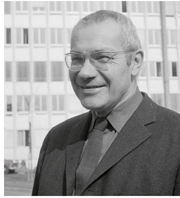
Max Bill (1908-1994). 1970.