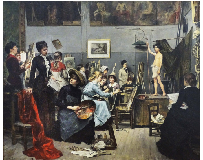
Marie Bashkirtseff (1858-1884). L'Académie Julian, 1881. Dnipropetrovsk State Art Museum.

Viertens nahm die Académie Julian – im Gegensatz zur Ecole des Beaux-Arts – auch Studentinnen an. Frauen wurden die gleichen Klassen wie Männern ange-