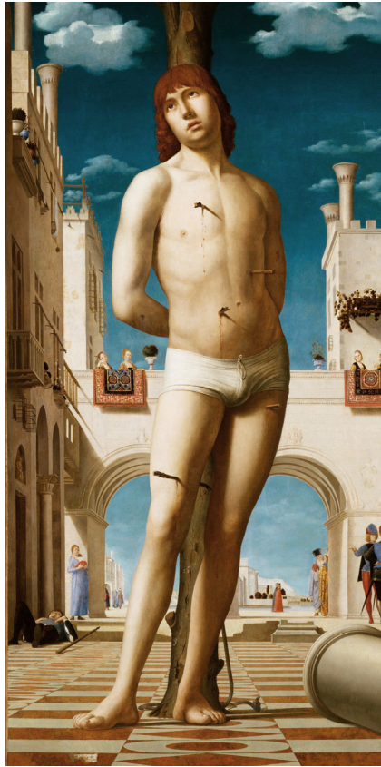
Antonello da Messina (1430-1479). Heiliger Sebastian , 1476. Gemäldegalerie Alte Meister Dresden.

Wer war Sebastiano? Er soll um 288 in Rom geboren sein. Er war römischer Soldat . Seit dem 4. Jahrhundert wird er als Märtyrer und Heiliger verehrt. Seine Jugend ver-