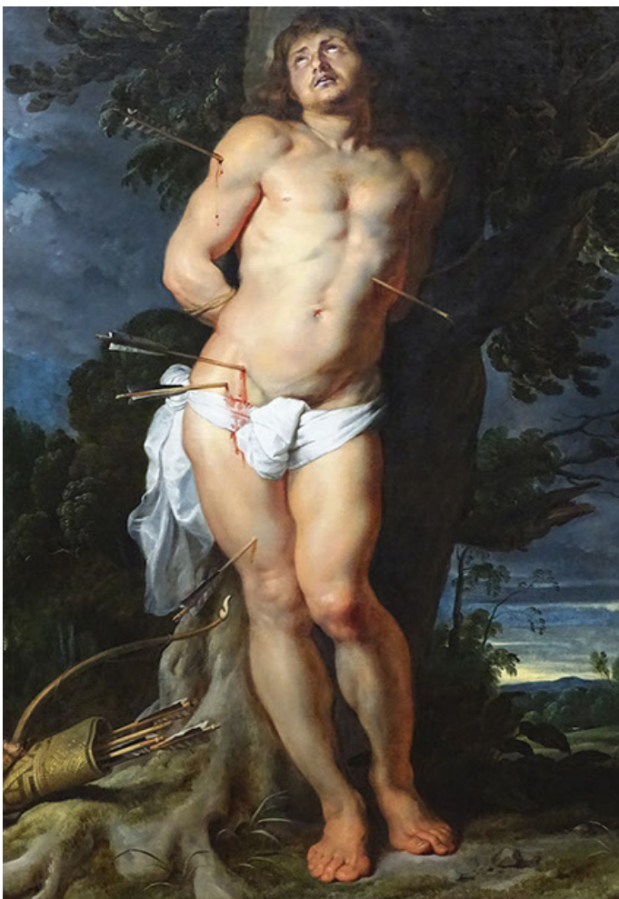
Peter Paul Rubens (1577-1640). Der Heilige Sebastian , 1618. Gemäldegalerie Berlin.

brachte er in Mailand; er wurde wegen seines guten Benehmens zum Offizier der Leibwache von Kaiser Diokletian und Maximian ernannt. Der Überlieferung zufolge hatte sich Sebastian als Hauptmann der Prätorianergarde am kaiserlichen Hof öffentlich zum Christentum bekannt und notleidenden Christen geholfen , woraufhin ihn Diokletian zum Tode verurteilte und von numidischen Bogenschützen erschossen liess. Im Glauben, er sei tot, liess man ihn danach liegen. Sebastian war jedoch nicht tot, sondern wurde von einer frommen Witwe, der Heiligen Irene , die ihn eigentlich für das Begräbnis vorbereiten wollte, gepflegt. Nach seiner Genesung kehrte er zu Diokletian zurück und bekannte sich erneut zum Christentum.